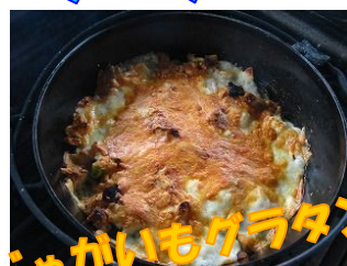
じゃがいもグラタン〜★

お待たせしました。今年度もはじまりましたファミリークラブです！ 今年度は5月、9月、12月、2月を予定しています。 5月のファミリークラブはあいにくの天気…しかし！！雨なんてへっちゃら★ 長靴、カッパ、軍手姿で気合をいれて畑へ向い野菜を収穫しました。 本日の収穫物は、じゃがいも、たまねぎ、だいこんです。 収穫した野菜を使ってじゃがいもグラタンを作りました。包丁を初めて使うお友だちもお母さんに教えてもらいました。 美味しいじゃがいも料理でおなかいっぱい！笑顔いっぱい！の一日になりました。 次回も、たくさんのファミリーの参加をお待ちしております★