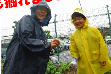
じゃがいも掘れました！