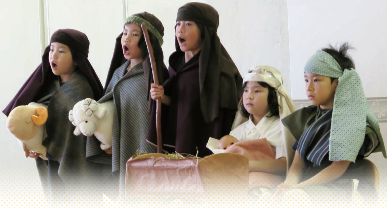
YMCAとさぼり保育園のクリスマス会

「ところが、彼らがベツレヘムにいるうちに、マリアは月が満ちて、初めての子を産み、布にくるんで飼い葉桶に寝かせた。