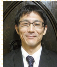
日本基督教団 浪花教会 牧師