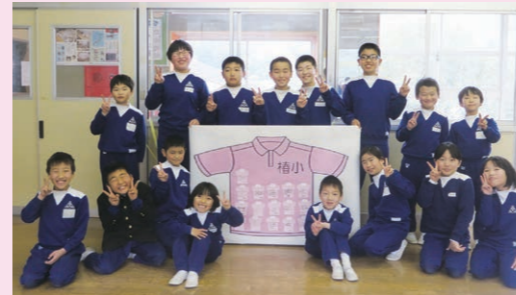
阿南市立椿小学校の子どもたちによるアピール

地域の学校などでは、ポスター掲示、ちらし配布、さらにいじめについての授業などが行われ、啓発活動が広がりました。