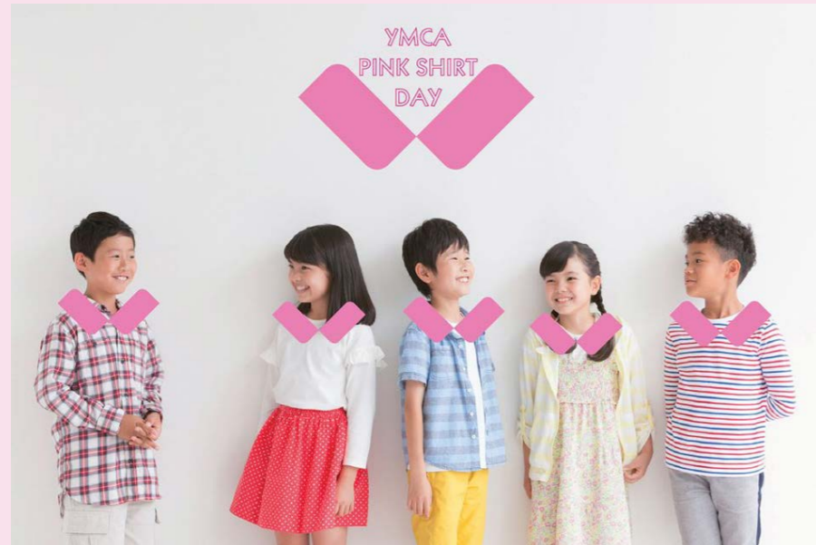
ブランディング制作 グラムコによるデザイン無償協力

全国のYMCAと行動を共にするピンクシャツデーも今年で4年目。大阪YMCAでは、2月をピンクシャツマンズとして、全事業所・活動拠点で多くの参加者と共に「いじめのない世界」をめざしてそれぞれの願いや思い、考えを発信しました。行政機関からの後援をはじめ、多くの企業・団体にも広く賛同を呼びかけ、40を超える団体の協賛と具体的な行動に結びつきました。